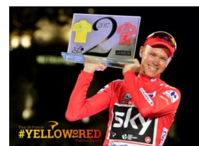
クリス・フルーム

2017年、“ツール・ド・フランス”4回目の総合優勝、さらにスペインの“ブエルタ・ア・エスパーニャ”を制し、イギリス人初のダブルツールを達成したクリス・フルーム。現役最強の呼び声も高い名選手が、“ツール・ド・フランス”&“ブエルタ・ア・エスパーニャ”で実際に使用したスペシャルカラーのピナレロドグマF10と共に『サイクルモード インターナショナル2017』に登場! その最高の走りを支えているイタリアの名門ブランド「ピナレロ」を率いるファウスト・ピナレロ社長も迎え、世界最高峰のロードレースの魅力に迫ります!