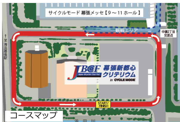
コースマップ ※9/26現在の情報であり、変更の可能性がございます。