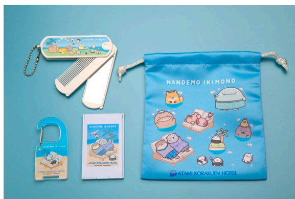
オリジナルノベルティ イメージ