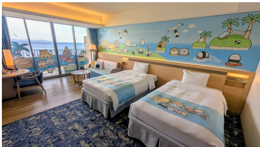
コラボルーム イメージ

URL： https://www.atamibayresort.com/nanmono-collaboration/