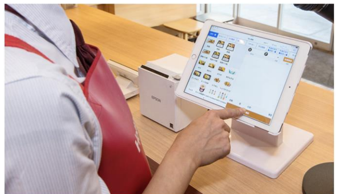
「Hotto Motto」店舗での利用シーン

画像は「一風堂」公式アプリ ( https://www.ippudo.com/appli/ )。2019年10月に「一風堂」の自社アプリとしてリリースし、現在は30万人が登録。