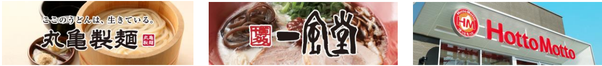
導入されている店舗一覧（写真は一例です）

「NEC モバイル POS」は、大手飲食店事業者をサポートできるサブスクリプション型 POS レジサービスです。NEC は、サブスクリプション型 POS の時代が来ることを確信し、7年前からサービスを提供してきました。長い時間をかけて市場で磨き上げられてきたサブスクリプションサービスは、今後もさらなる店舗サービスの強化や業務効率化に貢献してまいります。