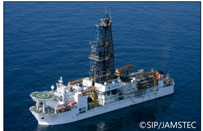
地球深部探査船「ちきゅう」