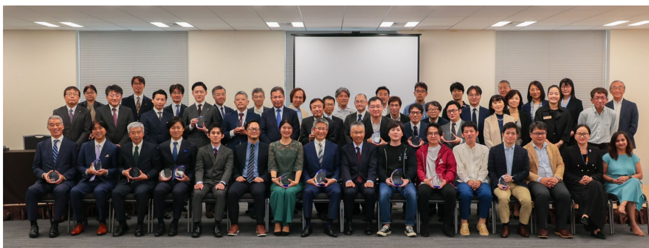
PM Award 2023 授賞セレモニーの様子

プロジェクトの専門家やチェンジメーカーのための世界有数の協会である Project Management Institute（PMI）は、この度 PMI 日本支部が主催する、日本発の優れたプロジェクトを表彰する「PM Award 2023」の授賞セレモニー開催に協力いたしました。今年度より、優れたプロジェクトを取り上げる機会拡大を目的として、「Large 部門※」と「Small and Medium 部門※」が新設されました。今年度の最優秀プロジェクト賞は、中小企業・小規模事業者が福利厚生として導入しやすい社員食堂補助システム「まちなか社員食堂 GoSmart」を開発した株式会社ネオマルスが Large 部門にて受賞、一般社団法人コード・フォー・ジャパンのカーボンフットプリント可視化プロジェクト「じぶんごとプラネット」が Small and Medium 部門にて受賞しました。また PMI Asia Pacific 賞は、「クロスボーダーM&Aによる国際事業のスピードアップ」を実施した東日本旅客鉄道株式会社が受賞しました。