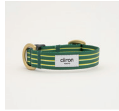
首輪 Trad Size: S/M- 細 /M- 太 /L