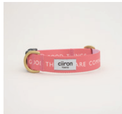
首輪 Happy Size: M- 太 /L