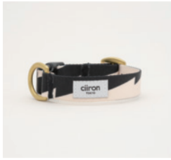
首輪 Thunder Size: S/M- 細 /M- 太 /L