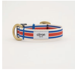
首輪 Sk8er Size: S/M- 細 /M- 太 /L