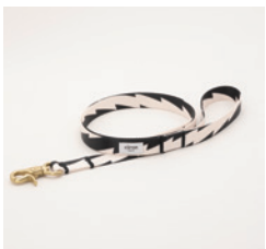
リード Thunder Size: 細 / 太