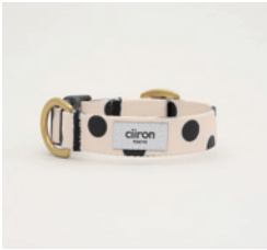
首輪 Dots Size: S/M- 細 /M- 太 /L