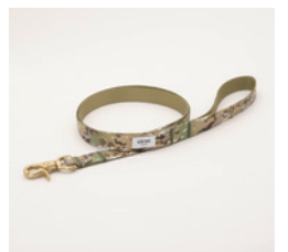
リード Camo Size: 細 / 太