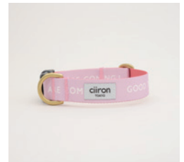
首輪 Lucky Size: M- 太 /L