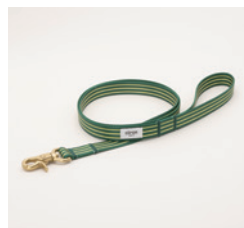
リード Trad Size: 細 / 太