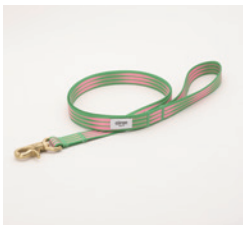
リード Pentas Size: 細