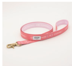
リード Happy Size: 太