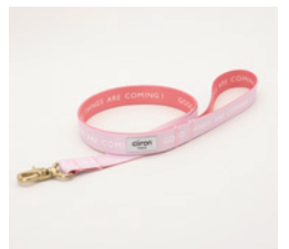
リード Lucky Size: 太