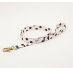
リード Dots Size: 細 / 太