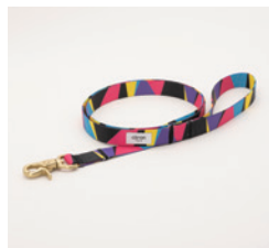
リード Polygon Size: 細