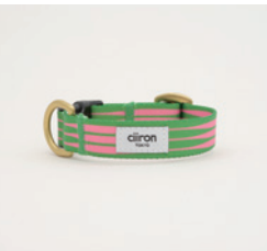
首輪 Pentas Size: S/M- 細