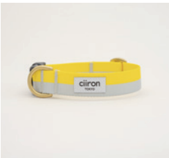
首輪 Lemon Size: S/M- 細 /M- 太 /L