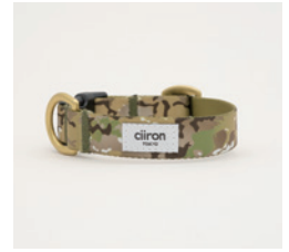
首輪 Camo Size: S/M- 細 /M- 太 /L