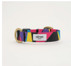
首輪 Polygon Size: S/M- 細