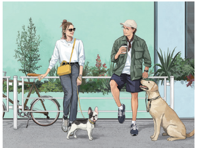
Illustration by SAITO YUSUKE https://saitoh-yusuke.com/

ブランドディレクターが愛する有名イラストレーター YUSUKE SAITO によるキービジュアル。「相棒とオシャレして出かけたいようなプロダクトを。」というブランドの想いを表現したビジュアルに。