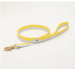
リード Lemon Size: 細 / 太