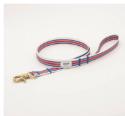
リード Sk8er Size: 細 / 太