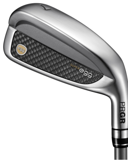
SUPER egg アイアン# 7