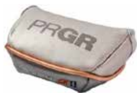
< 03,03CS 兼用 >

ご掲載時の読者の問い合わせ先 プロギアお客様相談室 TEL : 0120-81-5600