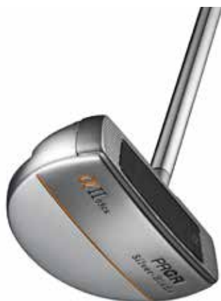
Silver-Blade αII 03CS

「Silver-Blade αII」は従来同様、ブレードとボディに異なる素材を採用することで比重差を生み出し、深重心、高慣性モーメント設計を可能にしています。また、ヘッドで使用しているシルバーカラーはブレードとボディでコントラストをつけることでアライメント効果を生み、ターゲットにまっすぐ構えやすいデザインにしました。フェースやボディは一部にCNCミルド加工を施すなど細部にまでこだわった仕上げとしたほか、グリップは握り心地が良く安定感を生み出すミッドサイズグリップを新たに採用しています。