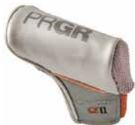
< 01,01CS,02 兼用 >