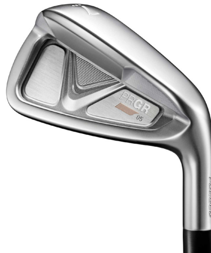
PRGR 05 IRON Ladies'