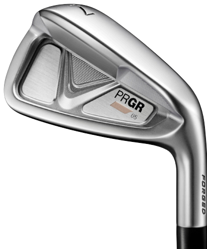
PRGR 05 IRON Men's

「PRGR 05 IRON」はシンプルにやさしく飛ばすため、ミドル、ショート、ウェッジそれぞれでクラブ長さを統一するとともに、重心はフェースセンターに配置しながら、「PRGR IRONS」の中で最も低深重心に設計しています。また、やさしいワイドソールでありながらも、リーディングに面取りを行うことで抜けの良さを向上させたほか、見た目もシャープで、構えやすさを追求しました。さらに、従来モデルからロフト角、クラブ長さのバランスをアップデートし、飛距離アップと上がりやすさを高めています。シャフトはメンズ、レディースそれぞれで、専用のカーボンシャフトを開発し、フレックス間で重量に幅を持たせることで様々なゴルファーに対応できる設計となっています。