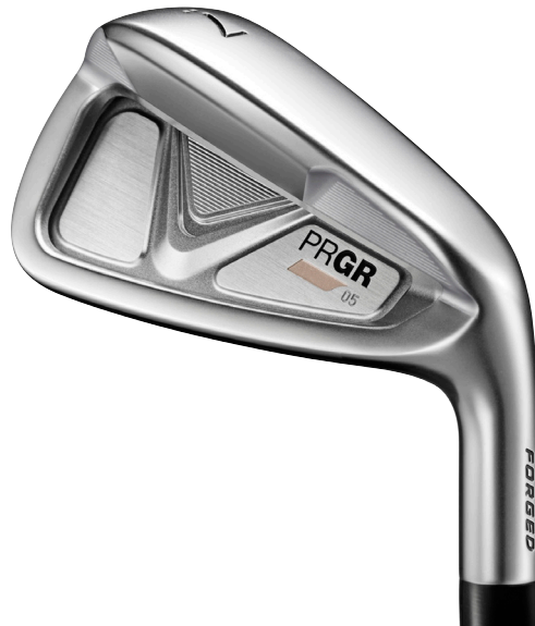
PRGR 05 IRON

構えやすさ、打感、飛距離性能、コントロール性、許容性（やさしさ）。 アイアンに求められる永久性能を徹底追及した、PRGR のフラッグシップアイアンブランド