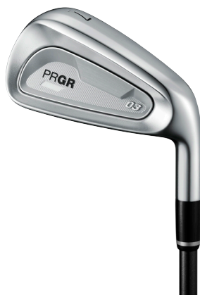
「PRGR 03 IRON」

「PRGR 03 IRON」は、バックフェースに滑らかで継ぎ目のない「Oval Cavity Design (オーバル・キャビティ・デザイン)」を採用し重量配分を最適化。さらにキャビティ内部にCNCミルド加工を施すことで、従来モデルを超える低重心化とフェースセンター重心を実現し、シャープな形状、かつストロングロフトでありながら、高弾道で許容性の高いアイアンに仕上げました。また、フェース設計はトップブレード側にかけて薄肉化する「グラデーションフェース設計」により、上打点での反発性能アップと低重心化、さらに打感改善を実現。加えて、番手ごとにフェース裏溝の本数、配置を最適化する「番手別バックフェースグループ」により、高い飛距離性能とイージーロング、コントロールブルショートを追求しました。このほか、ワイドソールでも抜けの良さを発揮する独自の面取り処理を施し、ウェッジはフェースをコンパクト化し操作性が向上、さらにバックフェース全体の余肉を取り除きシャープな印象とするなど工夫しています。シャフトはスチールシャフトのほかに、先端剛性を高め高弾道と操作性を両立した新開発の「Diamana™ M FOR PRGR」を用意しました。