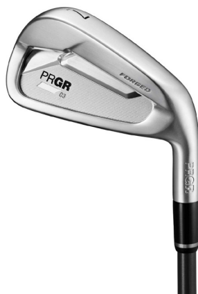
PRGR 03 IRON (#7)

「PRGR 03 IRON」のヘッドはミッドサイズとセミワイドソールで安心感を持たせながら、薄めのトップブレード厚やグースに見えすぎない工夫などでシャープなフォルムに仕上げている。そのため、飛び系アイアンにありがちなアドレスの違和感がなく方向性も出しやすいヘッドとなっている。また、高強度薄肉フェースやバックフェースグループによる高い反発性能に加え、低重心設計とセンター重心を両立させることで高初速、高弾道のぶっ飛び性能を実現させた。さらに番手別に高い精度で飛距離が打ち分けられ、左へのミスも軽減できるようロフト角、ライ角、クラブ長さを設計。打感は軟鉄鍛造ボディと高強度薄肉フェースで柔らかさと心地よい弾き感を両立させた。シャフトはスチールシャフトのほかに、しっかりとした振り心地のカーボンシャフト「Diamana™ FOR PRGR」を三菱ケミカル(株)と共同開発し、軽量スチールシャフトから移行しやすいやや重めのスペック(Sフレックス:75g)も用意している。