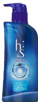
h&s モイスチャー 地肌ケア シャンプー (370mL)

地肌ケア成分「深海ミネラル※1」 配合で、純化クレンジング。乾 燥・かゆみ・フケを元から予防し、 1日中快適な地肌となめらかな つや髪へ。