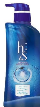
h&s モイスチャー 地肌ケア コンディショナー (370g)

地肌ケア成分「深海ミネラル※1」 配合で、純化クレンジング。べた つき・かゆみ・フケを元から予防 し、1日中快適な地肌とさらさら 髪へ。