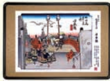
※限定記念額装木版画 イメージ図