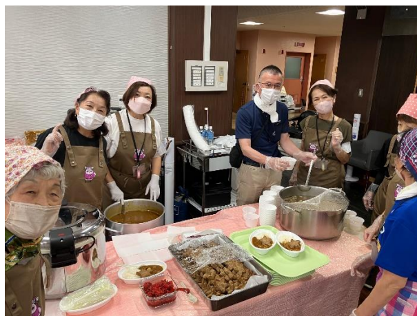
食事提供準備の様子