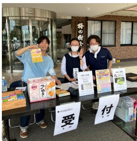
イベント受付の様子

同月、ボランティアに参加させていただき、野外テントの組み立てや机・椅子などの整備、そしてカレー150食分の提供をお手伝いしました。イベントは、野外コンサートやカキ氷の提供もあり大盛況に終わりました。日常生活の中で、中々体験できない活動で、来場された方に御礼を言われると嬉しくなりました。何でもそうですがやってみないと分からないので、本当に良い経験をさせていただきました。