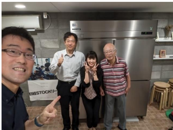
神戸支店社員 2 名と NPO 法人リーダーズ カフェスタッフの方々

同月、冷蔵食材の仕分け・保管作業のお手伝いをさせていただき、また勉強会にも参加し、勉強会後に子どもたちに食材を手渡ししました。食材をお渡しさせていただいた際は笑顔で受け取り、嬉しそうに中身を確認しながら持ち帰ってくださいました。この活動に携わることができ良かったと実感しました。