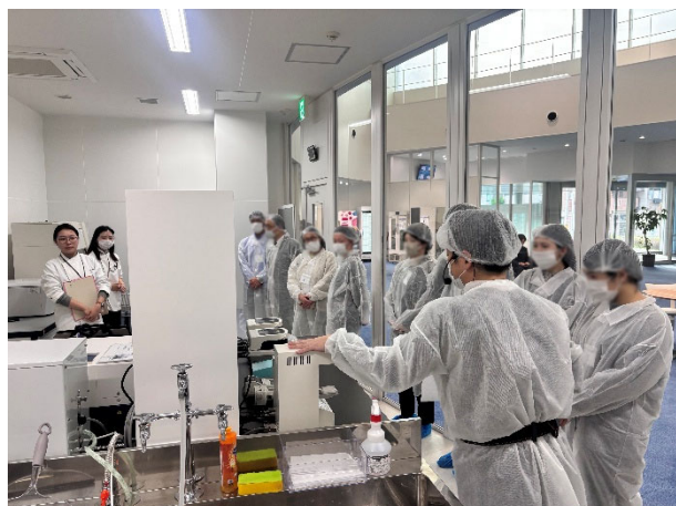
MILAB 食品研究室の分析機器を説明