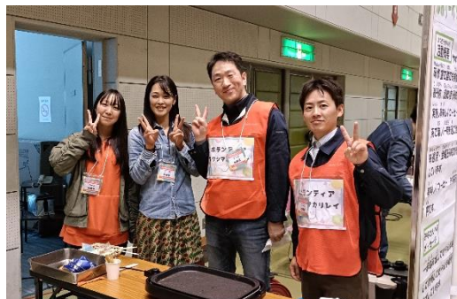
イベントでの出展サポートの様子

・初めてのボランティア参加で、戸惑う部分もありましたが、子どもたちや子育て支援をしている方たちとの交流でき、非常に有意義な機会になりました。また、多目的保冷庫の寄贈で地域貢献できたことも嬉しく思います。