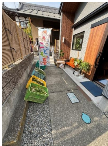
地域の方から寄付された野菜