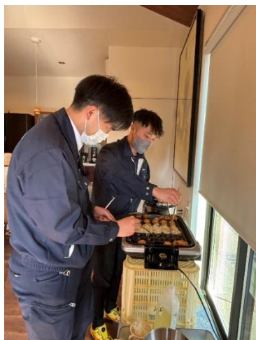
たこ焼きづくりの様子

・フードロス削減にも繋がる取組もされていますので、また何かしらの形でサポートしたいとお思います。