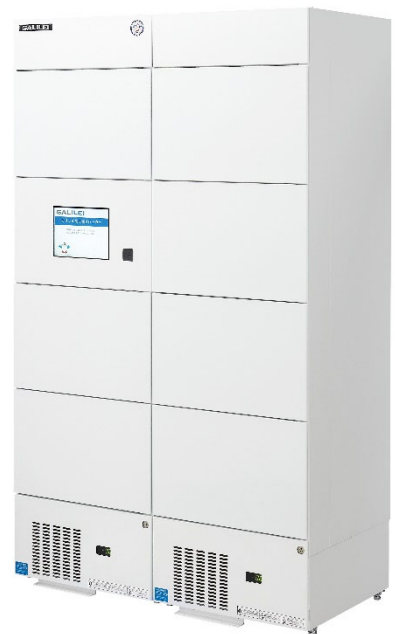
写真左：制御ユニット(3室)

冷凍機を製品下部に設置することで、最下段でも出し入れがしやすくなっています。冷凍機ユニットは引き出し可能でメンテナンス性も考慮しています。