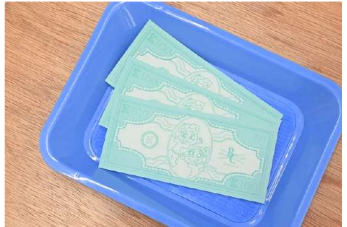
(タウンの銀行で発行される偽装通貨「ケビィ」)

KBCタウンは街や模擬店を作る実践的な活動を通して、子どもたちの自主性や積極性はもちろん、論理的思考や計画性、他者との会話（コミュニケーション力）など多くの非認知能力の成長が期待されるイベントです。