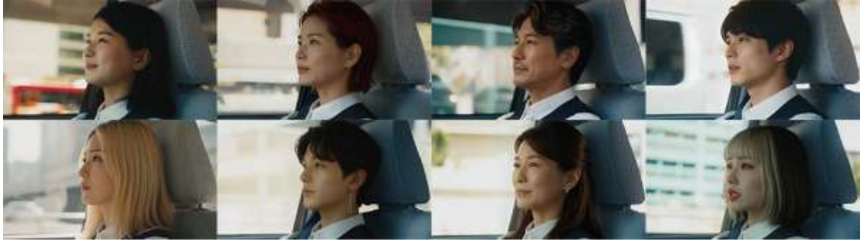
動画内では「婦人」という言葉の定義を模索しながら、主人公が多様な姿に変化していきます。

表現においても、これまでの120年とこれからの未来を繋ぐ挑戦として、実写とAIを融合させるという新たな手法を取り入れました。主人公の女性が多様な姿へ変化していく映像を通して、人の生き方や価値観に寄り添い、その時代の技術を取り入れながら進化を遂げていきたいという当社の企業姿勢を象徴的に描いています。次の一世紀も私たちは「感動を編集し時代を創る」人であり続けます。