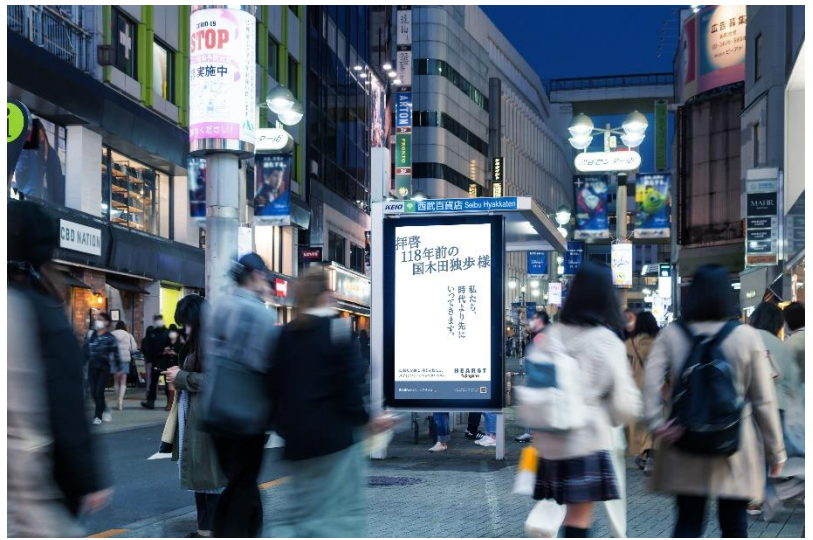
東京都内バス停広告