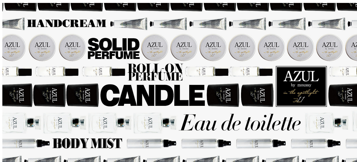
Eau de toilette 2,990 Roll-on perfume 1,690 Body mist 2,390 Hand cream 1,990 Solid perfume 1,690 Candle 1,990

青く続く海岸線には、打ち寄せるやわらかく白いさざなみ。 爽やかな潮風感じるビーチを抜けた森の奥深いダークな中で、 木々の隙間から射し込んだ光が、まるで、輝くスポットライトをあてられた、 溢れる光の中に立っている。 エレガンスでありながら、 甘く、セクシーな、 魅惑的な香り。