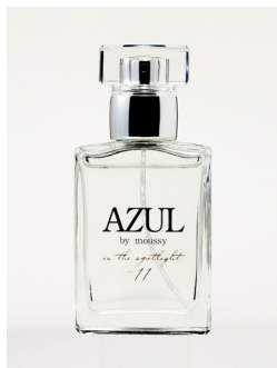
Eau de toilette 2,990

「 in the blue sky with marine breeze and on the shore line, fluffy white cloud and ripple passing through the beach with Clean Crisp Air in the deep and dark forest the sun got in through between blue Hemlock trees as if standing in the spotlight with brightness and flooded light elegant, sweet and sexy enchanting scent 」 by Christophe Laudamiel