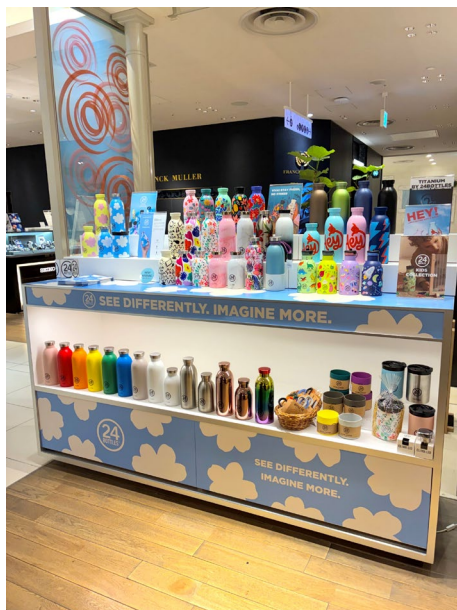
ワイ・ヨットストア 渋谷では デイドリーミングを中心とした 24Bottlesコーナーを展開中