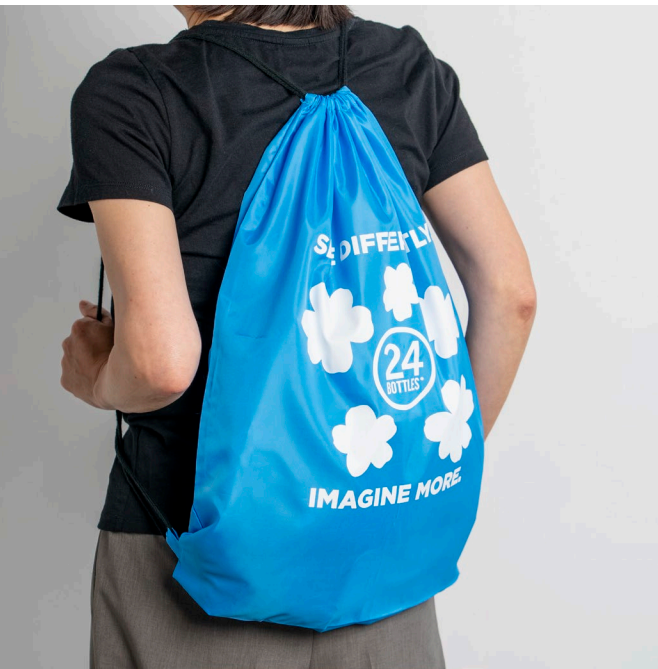
デイドリーミング・ランドリーバッグ 横42×高さ53cm ポリエステル製