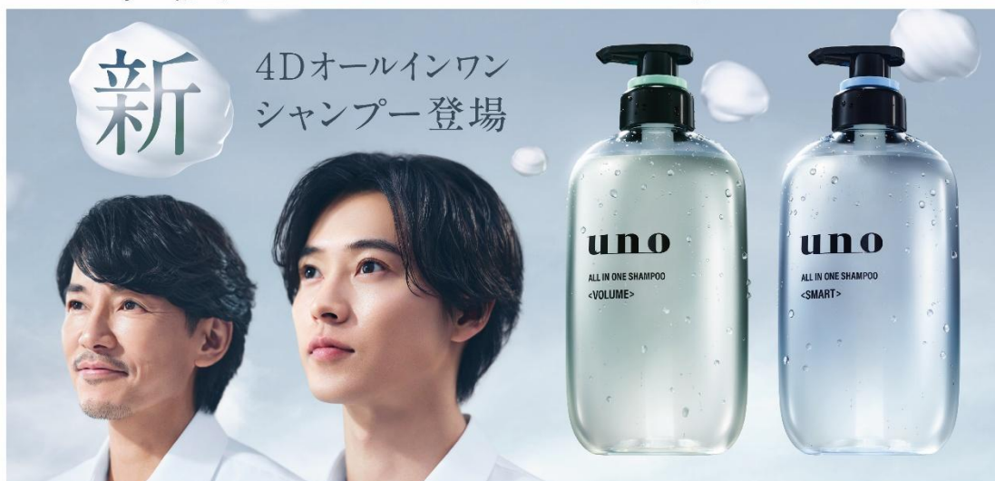
ウノ オールインワンシャンプー ボリューム ウノ オールインワンシャンプー スマート