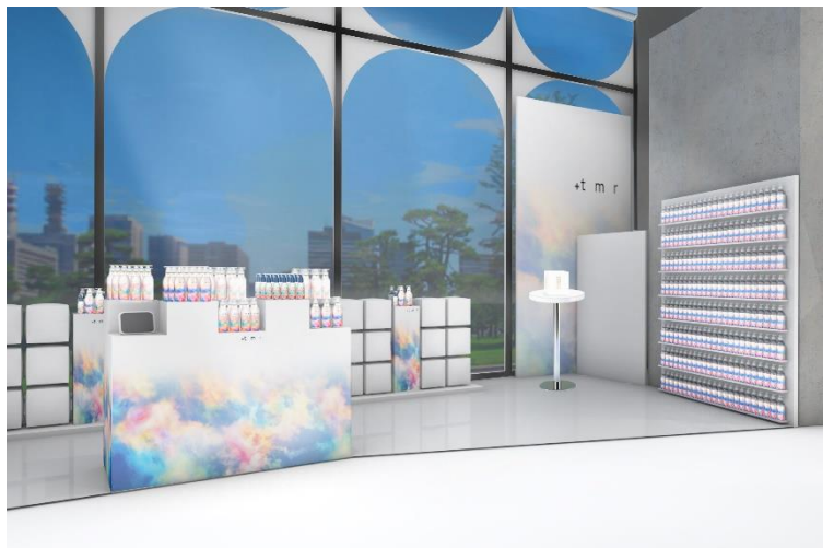
【1F POPUP ブース右手】