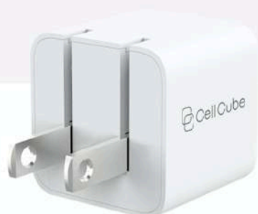
CellCube 1ポートGaN30w Fast Charger