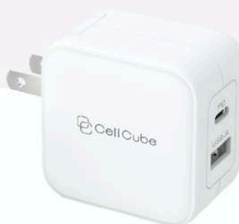
CellCube 2ポートUSB-C Fast Charger(PD20W+12W)