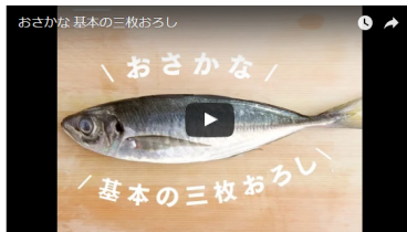
【おさかな基本の三枚おろし！】

魚の三枚おろしって実際にやってみるとなかなか上手いじゃない事が多いですね。そんな、一度は経験ある方や、これからチャレンジしようと思っている方に簡単に魚をさばくコツをご紹介します。今回はアジを使用。（他の魚でも同様です）魚がさばいたら、料理の幅が広がる！新鮮な味を楽しめる！そして何より経済的なんですよ（*^^*）