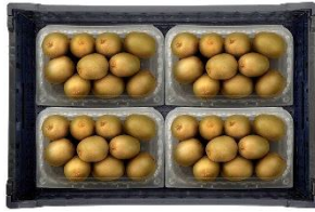
▲VFC-8AP 8個 (4個×2段)