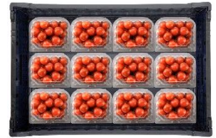
▲VFC-24(12×2)AP 24個 (12個×2段)