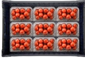
▲VFC-18(9×2)AP 18個 (9個×2段)