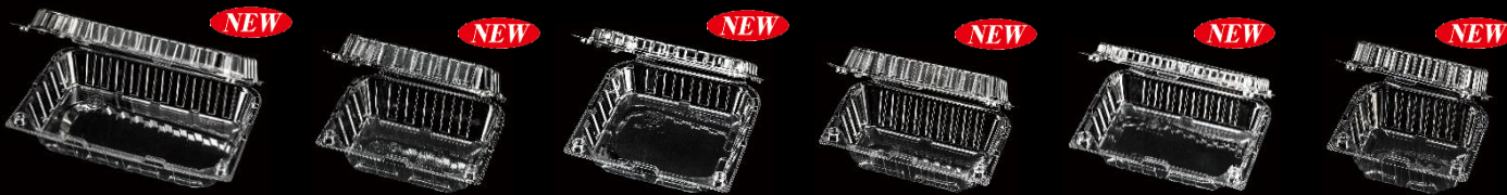
▲VFC-8AP ▲VFC-16AP ▲VFC-18 (6×3) AP ▲VFC-18 (9×2) AP ▲VFC-24 (8×3) AP ▲VFC-24 (12×2) AP