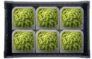
▲VFC-18(6×3)AP 18個 (6個×3段)