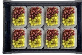
▲VFC-24(8×3)AP 24個 (8個×3段)