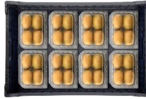
▲VFC-16AP 16個 (8個×2段)