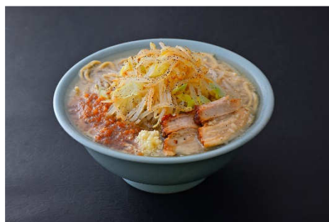
写真は調理例。商品は冷凍になっており、含まれる具材はチャーシューのみです