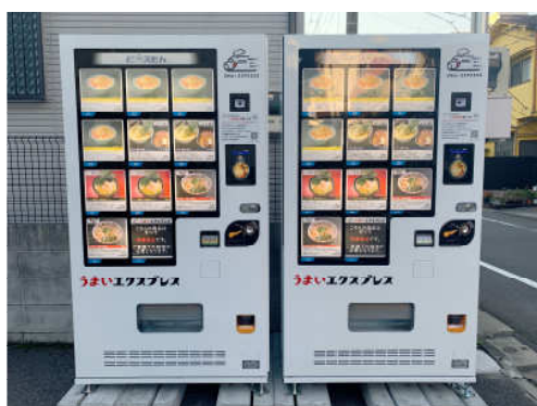
亀戸店（東京都江東区亀戸 6-50-6）

このたび「うまいエクスプレス」で導入する自動販売機は、サンデン・リテールシステム株式会社が開発したマルチストック型冷凍自動販売機「ど冷えもん」をベースに、共同で独自のカスタマイズを加えたものを採用。ECサイトで表示されるQRコードをスマートフォンで表示させ、自動販売機に搭載された読取り装置にかざすことで会員を識別します。