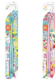
【オーラツーツー ステインクリア ハブラシ】