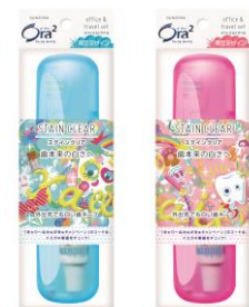
【オーラツーツー ステインクリア オフィス&トラベル】

<お客様からの商品に関するお問い合わせ先> サンスターお客様相談室 TEL:0120-008241(平日 9:30~17:00 土日祝除く)