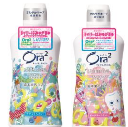
【オーラツーツー ステインクリア デンタルリンス】