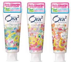
【オーラツーツー ステインクリア ペースト】

希望小売価格:440 円(税抜)／475 円(税込)※ ※2014 年 4 月発売時(消費税 8%)