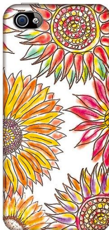
パッションサンフラワー

ホワイト×ブラックのドットの背景にとびっきりオシャレをした茶トラの猫がかわいらしい。サングラスと蝶ネクタイを付けてすっかりその気になっている猫のキュートでオシャレなケース。