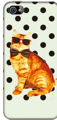
ドレスアップキャット

マリンルックを思わせるボーダーのシャツにイエローのセーターを肩から掛けたファッションのイラストがオシャレ。『Follow the window'風を追う』のメッセージがアクセントになっています。