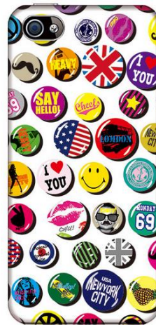
バッジコレクション

フリーハンドで元気いっぱい描かれた鮮やかなカラーのひまわりのイラストがアクティブな印象。ホワイトのケースに映える大ぶりのひまわりが存在感たっぷり目を惹きます。