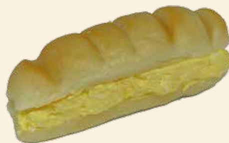
タマゴサラダ 160 (税込) 円