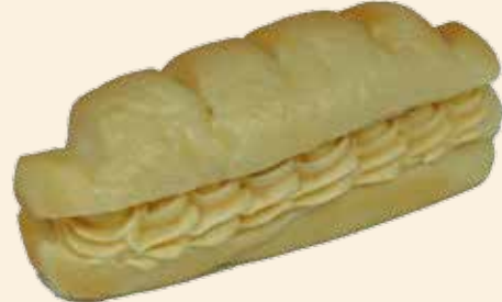
ホイップ ピーナッツ 180 (税込) 円

香ばしいクルミと濃厚メープルシロップが絶妙!! やわらかクリームチーズでジューシー感アップ。