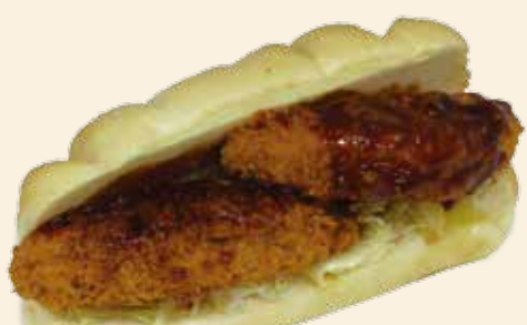
男爵ポテト コロッケ 250 (税込) 円