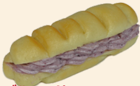
ブルーベリー クリームチーズ 230 (税込) 円