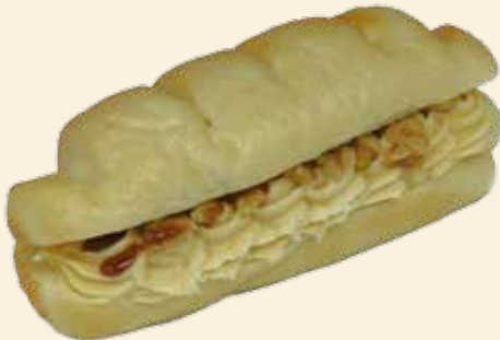
メープルクルミ 230 (税込) 円

香ばしいクルミと濃厚メープルシロップが絶妙!! やわらかクリームチーズでジューシー感アップ。