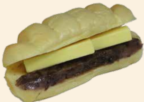
アンバター 160 (税込) 円