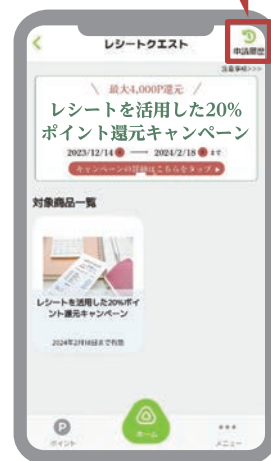
⑧ 「申請履歴」で審査結果を確認!