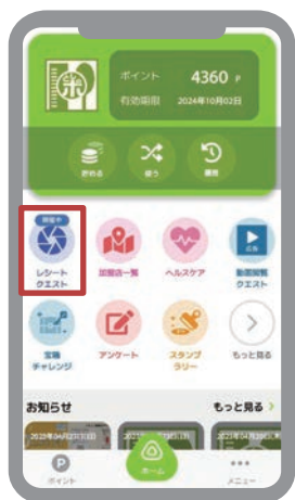
① としポアプリ内の「レシートクエスト」をタップ