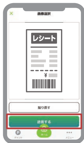
⑥ 「送信する」をタップ