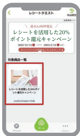
② 「レシートを活用した20%ポイント還元キャンペーン」をタップ