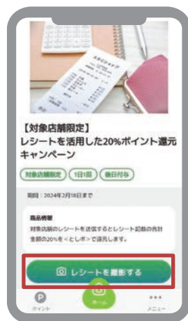
③ 「レシートを撮影する」をタップ