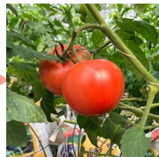
実際に育った トマト