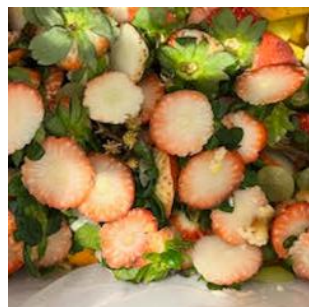
施設の食品廃棄物 (食材の切れ端や食品ロスなど)

リエール藤沢をはじめとする施設から排出される食品廃棄物は、リサイクル工程を経て肥料としても生まれ変わり、藤沢市内の農家による野菜づくりに活用されています。この食品廃棄物由来の肥料を使うことで、野菜はじっくりと生育が進み、 旨みやコクのある味わい になると言われています。本フェアでは、この肥料で育てられた藤沢産野菜の「味の濃さ」や「素材のおいしさ」を生かし、リエール藤沢のカフェ・レストランにて提供します。