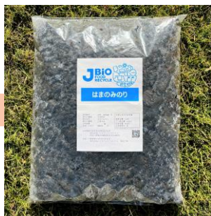
食品廃棄物からできた 肥料