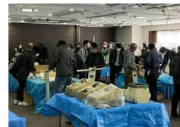
写真はイメージです。 実際に販売する商品とは異なります。