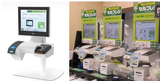
セルフレジ増設を加速中

※Suicaのペンギンは東日本旅客鉄道株式会社の「Suica」のキャラクターです。