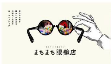
まちまち眼鏡店 本

江戸末期の1864年に神田元岩井町（現岩本町）で創業した江戸千代紙、おもちゃ絵の老舗・版元。店内には千種類にも及ぶ千代紙やおもちゃ絵があり、江戸の粋なデザインを施した和文具、おもちゃ、縁起の張子などがずらりと並びます。