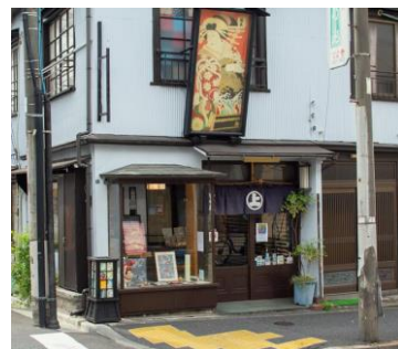
菊寿堂 いせ辰 雑貨

千駄木駅徒歩1分にある古着屋。ロサンゼルスでの買い付けをメインに60-80年代頃のヴィンテージアイテムを取り扱っています。特に、オリエンタルやエスニックな雰囲気ヴィンテージ服を取り扱っています。