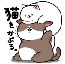
まんじゅうこわいこや！