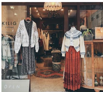
KILIG vintage 古着屋

間借りの花屋「soco」です。純粋にその時期綺麗で惹かれるお花、お客さまに似てるお花、街の人がきっと元気になるお花を仕入れています。流れの中で頭で色々な物事が混ざってsocoを表現できてたらいいなと思っています。