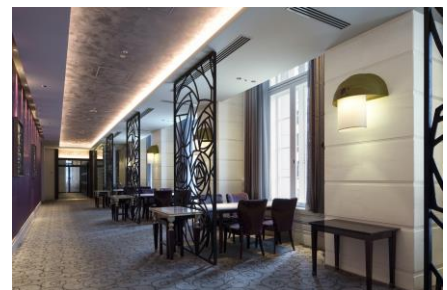
※東京ステーションホテル「バー&カフェ カメリア」イメージ

https://www.jrepoint.jp/campaign/0061001268/ (1月27日公開予定)