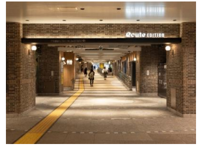
※エキュートエディション横浜イメージ

エキュートエディション横浜は「EKINAKA BYROAD 『TSUDOU』（エキナカで脇道に入って集う憩いの場）」をコンセプトに、いつものエキナカ（EKINAKA）でちょっと脇道（BYROAD）に入って“集う（TSUDOU）”憩いの空間を提供する、飲食店4店とシェアオフィスから成っています。仕事やお出かけの行き帰りの隙間時間、お買いものの合間にコーヒーを片手に一息入れたり、シェアオフィスでちょっと仕事をしたり、さらにその日の気分で日本酒やワインを“ちょい飲み”するなど、様々な利用シーンでご利用ください。