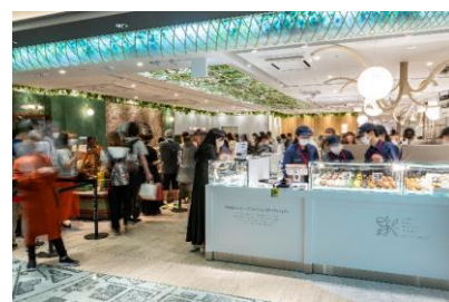
※新スイーツゾーン雑観

「Essence Selection」をコンセプトに、2024年9月にオープンした「グランスタ東京」の新スイーツゾーンからは、エキナカ新登場の話題の専門店が手がけるオーガニック素材にこだわった商品や、期間限定のタルト・カヌレなど、スイーツ好きにおすすめしたい特別感のあるホワイトデーギフト5選をご紹介します！素材の良さ・手作りの美味しさなど、職人の技が詰まったスイーツはもちろん、各ブランドの世界観もあわせてお楽しみください。