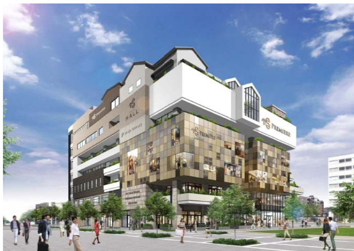
<プレミア ヨコハマ 外観 完成イメージ>

我々はプレミア ヨコハマが地域の皆さまのパブリックな場所として、街と、そこに暮らす方々とともに成長し、変化していく施設でありたいと考えています。日常＝「衣・食・住」の先にある新しいステージへの牽引役となり、「美・飾・自由」というライフステージを形づくることを目標としています。時代とともに変化していく、女性が求める「美しさ」や「楽しさ」を敏感に柔軟に捉え、「街」と「あなた」が求める場所となり、様々な商品やサービスを提供してまいります。