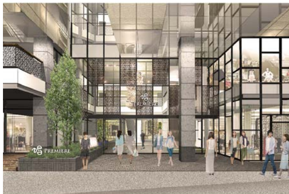
〈プレミア ヨコハマ 正面入口 完成イメージ〉

プレミア ヨコハマは、女性が活き活きと美しく過ごすために必要なコトやモノが揃う場所を目指し、「きれいも、おしゃれも、たのしいも、おいしいも、ここにある。」とお客様にご満足いただけるショッピング環境を創造します。