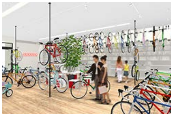
<SAKURA JITENSHA SHOKUNIN KYOTO 店内イメージ>

また、インテリア以外にも京都発の自転車職人のいる サイクルショップ「SAKURA JITENSHA SHOKUNIN KYOTO」 (1F/株式会社サクラ)が港北エリアのライフスタイルをイメージ した感度の高い自転車やアクセサリ、ウェアをラインナップ。 安心安全かつ快適な「価値のある自転車生活」をお届けします。