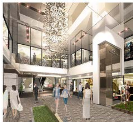
<正面エントランス 完成イメージ>

プレミア ヨコハマでは、開業日の前日、10月24日(木)午前10時~午後1時の時間帯に媒体関係者様向けの施設内覧会を実施予定です。内覧会の詳細につきましては10月初めに改めてご案内させていただきますので、どうぞよろしくお願いいたします。