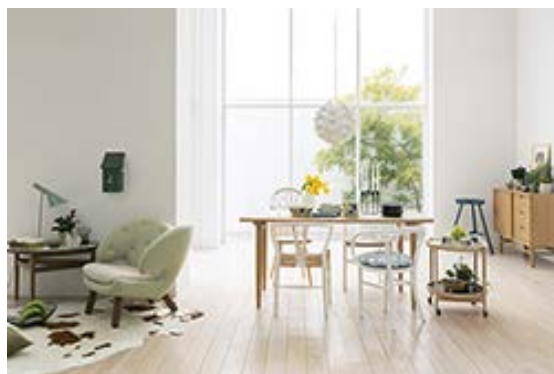
〈EDITION BLUE 商品イメージ〉

IDC OTSUKAがデザインオフィスnendo(ネンド/代表:佐藤オオキ)とコラボレーションした話題のセレクトショップで、青山・新宿に続く国内3店舗目のショップとしてオープンします。スカンジナビアモダンをコンセプトとするライフスタイル専門店「イルムス」(4F/株式会社イルムスジャパン)や、1952年デンマークで創業した「Bo Concept」(4F/株式会社ボーコンセプト・ジャパン)など大型インテリアショップが揃い、北欧デザインの多様性をお楽しみいただけます。北欧だけでなく国内外の良質な家具・雑貨を提供するショップも充実しており、オリジナル家具や国内外の雑貨をセレクトする「unico」(2F/株式会社ミサワ)や、確かな技術とデザインのオーダーメイドソファ専門店「ラフィネリビング」(4F/ラフィネリビング有限会社)、ニューヨークで第一号店をオープンした「新感覚和モダン」がコンセプトの「和技WAZA」(4F/エクシーズ株式会社)など多彩な店舗が揃います。