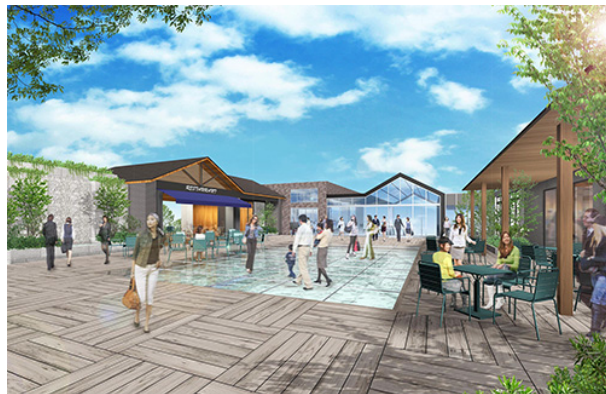
〈プレミア ヨコハマ 7F屋上完成イメージ〉