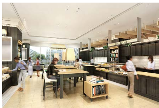
<SWEETS TERRACE 店内イメージ>