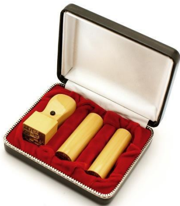
法人印鑑3本セット (実印・角印・銀行印)