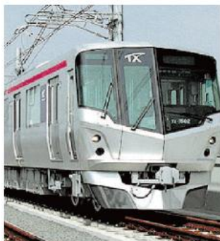
「三郷中央」駅 徒歩 6 分 (480m)

三郷市の新しい玄関口にふさわしい中心市街地「三郷中央」は、都市拠点として位置づけられ、商業施設やオフィスのほか、水と緑の調和した街づくりを推進しています。開発とともにもっと暮らしやすくなる、これからの三郷中央地区にもご期待ください。