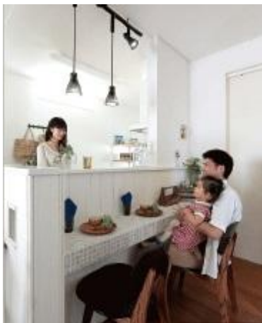
①手づくり感あふれるおもてなし ～シャビー壁のある「カフェの家」～

それぞれの家族には、それぞれのライフスタイルがあります。『川越クレストヴィラ 新宿町』では、多彩な暮らし方に応じて選べる3種類のプランスタイルをご用意しました。