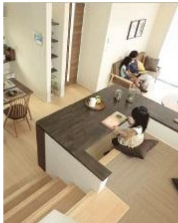
②家族の隣で楽しむ自分時間 ～アルピ壁のある「SOHOの家」～

キッチンからおもてなしできるタイルカウンターは家族が気軽に朝食やおやつを食べられるスペース。モザイクタイルは落ち着いたベージュの色味で品の良い高級感を演出。熱や汚れにも強くお手入れが簡単。