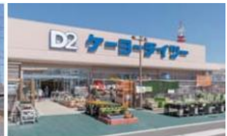
ケーヨーデイツー 180m / 徒歩 3分

交通： JR 川越線・東武東上線「川越」駅より「大宮」駅まで 23 分、「池袋」駅まで 30 分、「新宿」駅まで 37 分（池袋で乗り換え）、「東京」駅まで 47 分（池袋で乗り換え）