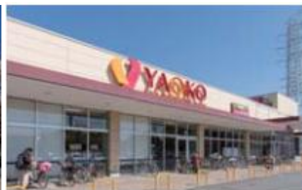
ヤオコー 310m / 徒歩 4分