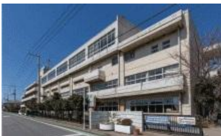
川越市立新宿小学校 250m / 徒歩 4分

池袋へ直通の東武東上線、大宮・新宿方面への便利な JR 川越線（埼京線）、所沢から新宿方面へのつながる西武新宿線の 3 路線を利用でき、駅までのバス便も充実し、毎日の通勤・通学に余裕が生まれます。また、現地周辺には幼稚園・保育園が点在し、小学校も間近な場所に立地。行政の子育て制度も整い、教育環境も充実しています。