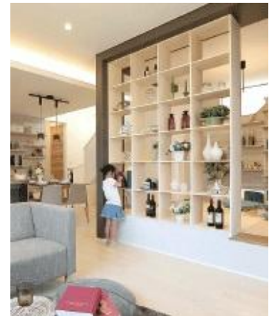
③料理も勉強も家族と一緒に ～ラスティック壁のある「広場の家」～

家族とほど良い距離感で仕事や趣味の作業が行える SOHO スペース。カスタムシェルフを設置しているので本や文房具もすっきり収納できます。PC コーナーやお子様の宿題スペースとして活用できるなど、フレキシブルなしつらえです。