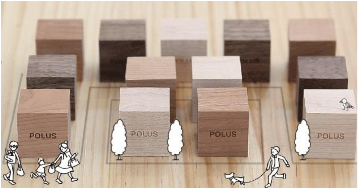
※『きなるのまちプロジェクト in 白岡』イメージ画像