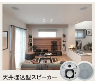
天井埋込型スピーカー