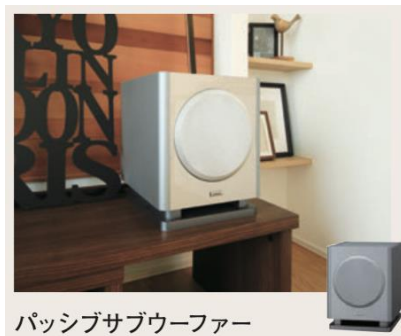
パッシブサブウーファー