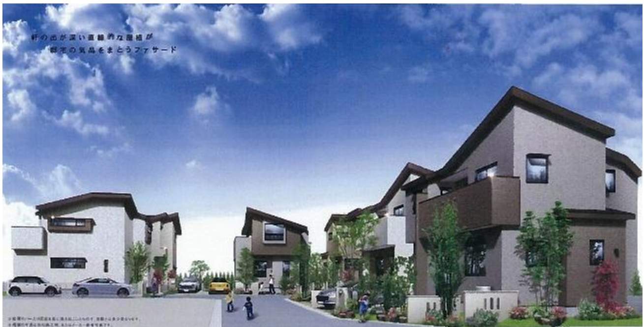
※「ヒトトキの丘 我孫子・緑」イメージ画像