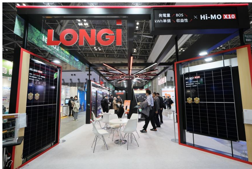
新製品「Hi-MO X10」を日本市場で初展示