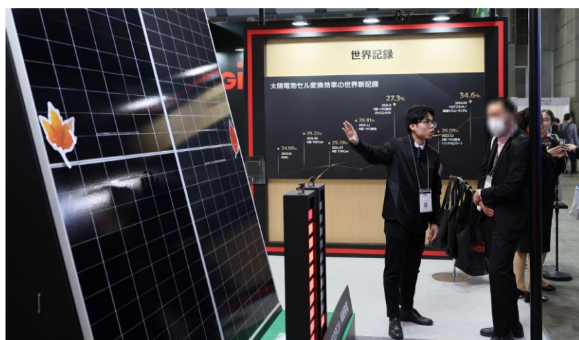
部分的な影への対応機能のデモンストレーション（従来製品との比較を分かり易く展示）

特に注目を集めたのが、部分的な影への対応機能のデモンストレーションです。太陽電池モジュールの一部に実際に影をかける実験を通じて、「Hi-MO X10」が部分影の影響を最小限に抑え、高い発電効率を維持できることを実証しました。多くの来場者がこの技術に関心を示し、製品の優れた性能に高い評価をいただきました。