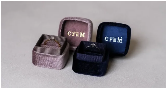
選べるミニケース