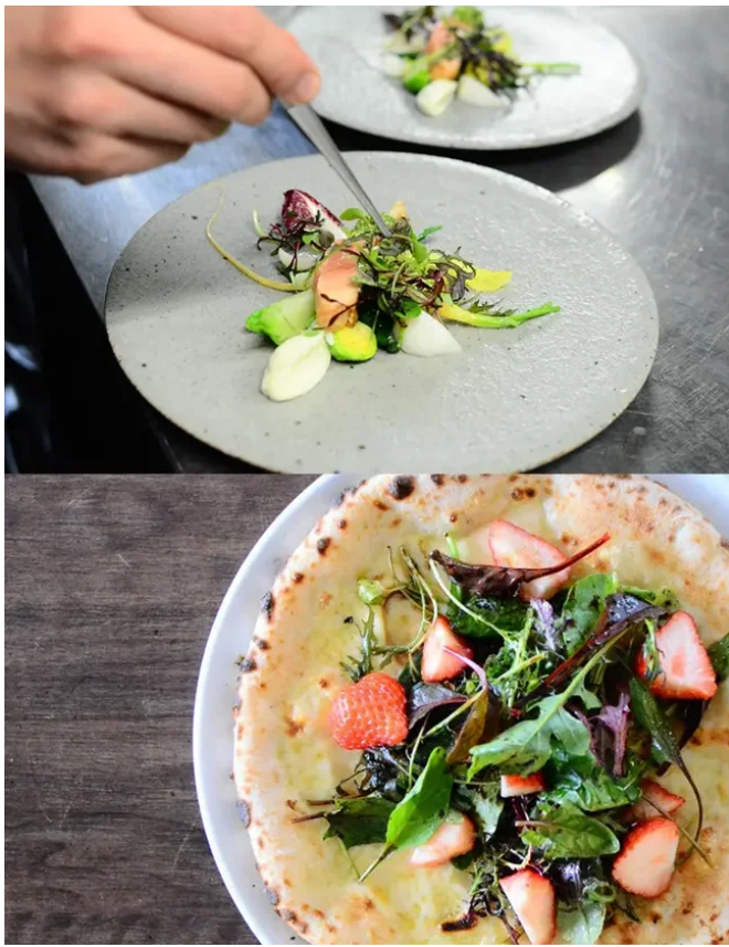
アー・アツラ・ゼータのランチ

さらに、フェア期間中にブライダルリングをご成約いただいたお客様の中から抽選でアー・アツラ・ゼータでご利用いただけるランチお食事券を4組様にプレゼントいたします。